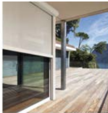
Bild: Teba Fensta_grau 31503 Social Media Bildformat Textvorschlag SoMe:

Unsere kreativen Posts sind darauf ausgerichtet, die Aufmerksamkeit Ihrer Kunden zu wecken. Die Inhalte bieten sowohl informative / beschreibende Texte als auch ansprechende Visuals . Natürlich können Sie die Texte nach Belieben anpassen, um sie optimal auf Ihre Zielgruppe und Ihr Branding abzustimmen. Nutzen Sie diese Gelegenheit, um Ihre Online-Präsenz zu stärken und Ihre Kunden mit wertvollen Produktinformationen zu versorgen. Und das ganz entspannt!