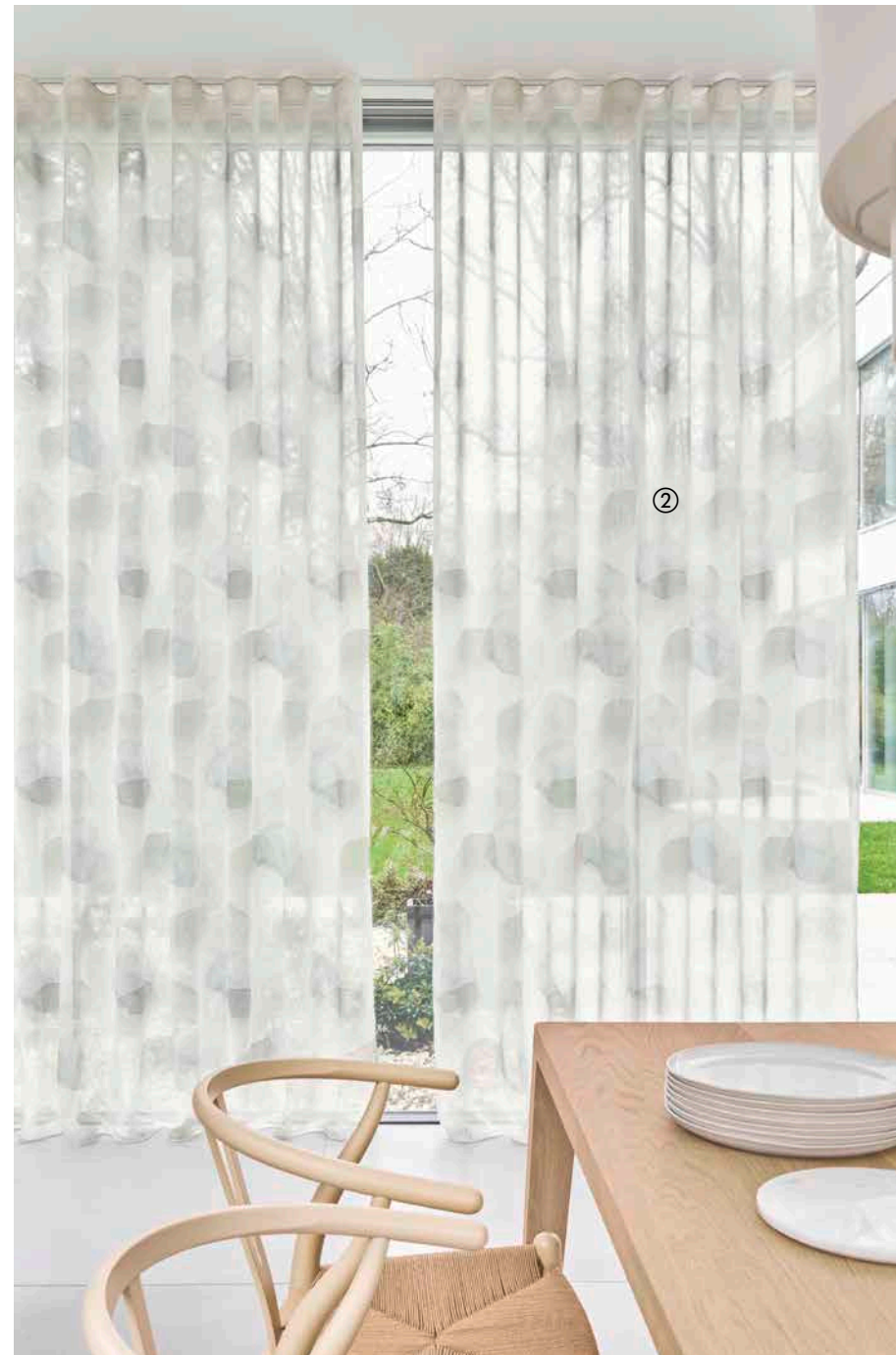
① CROSSING JA8070-090 ② WATERCOLOR JA8075-051

CROSSING mit hohem Baumwoll- und Viskoseanteil zeigt eine lässige Interpretation eines Karodessins. Der Ausbrenner wurde farbig überdruckt. Die zwei Ebenen des Dessins wirken malerisch wie ein Aquarell – erhältlich in 6 Farben.